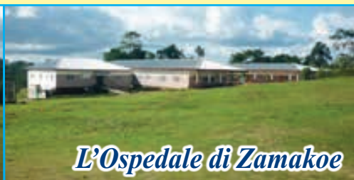
L'Ospedale di Zamakoe

Dopo la visita al nostro progetto da parte del fondatore (settembre 2012) sono stati assunti presso l'Ospedale "NOTRE DAME DE ZAMAKOE" altri due nuovi medici per le consultazioni e le visite giornaliere. Anche per il reparto di chirurgia abbiamo assunto un nuovo medico chirurgo che interverrà sui casi più urgenti di primo soccorso. Dal suo arrivo abbiamo constatato che sono ormai decine anche le operazioni chirurgiche programmate ogni mese. Il nostro impegno mensile si aggira sui 2.000