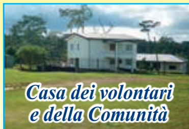
Casa dei volontari e della Comunità