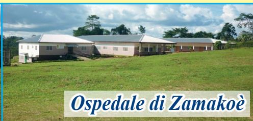
Ospedale di Zamakoè

Dopo la visita al nostro progetto da parte dei responsabili dell'Associazione (novembre 2024) sono stati confermati presso l'Ospedale "NOTRE DAME DE ZAMAKOÈ" tutti i progetti ed i servizi nati per i più poveri. Ogni giorno è garantita la presenza di medici per le consultazioni e le visite. Per il reparto di chirurgia è stato confermato il medico chirurgo che ormai lavora con noi da anni. Ogni mese sono decine ormai le operazioni chirurgiche. Il nostro impegno mensile per sostenere il progetto è di 1.500 euro necessari